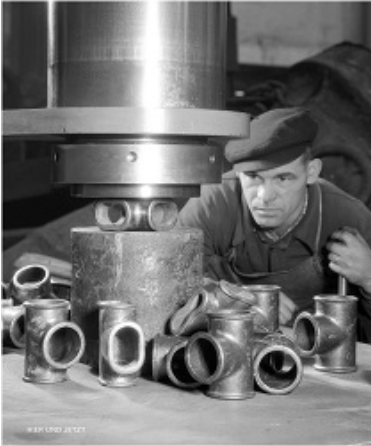
Blicke in das Konzernarchiv der Georg Fischer AG